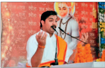
हरिभूमि न्यूज़ ►► कसडोल