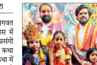
देखा नहीं बल्कि नारद जी से उनके गुणों का बखान सुनी जिससे रुक्मिणी को प्रेम हो गया। महाराज जी ने कहा यही तो नवधा भक्ति है पहले भगवान की कथा सुनी जाती है तब भगवान से प्रेम होकर हम भगवान के बन जाते है। बड़े भव्य रूप से यह भगवत कथा हो रही है महाराज जी सबसे बोले कि अपना जीवन धर्म के नाम चढ़ा दो क्योंकि जो धर्म की रक्षा करता है धर्म उसकी रक्षा करता है।